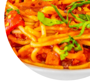
Tavola Bottigliera Con Cucina